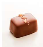
スモークトソルトキャラメル ソフトバターキャラメルをミルクチョコ レートでコーティング、スモークソルトを トッピング。オーガニックとフェア トレード認証。