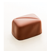
クラシックミルクキャラメル ソフトバターキャラメルをミルクチョコ レートでコーティング。オーガニックと フェアトレード認証。