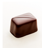
クラシックダークキャラメル ソフトバターキャラメルをダークチョコ レートでコーティング。オーガニックと フェアトレード認証。