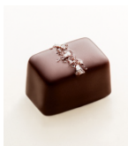
グレイソルトキャラメル ソフトバターキャラメルをダークチョコ レートでコーティング、グレイソルトを トッピング。オーガニックとフェア トレード認証。